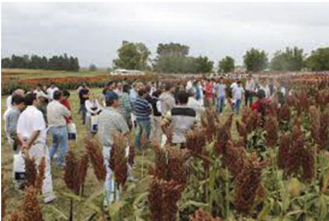
Reapertura de la Chacra al público