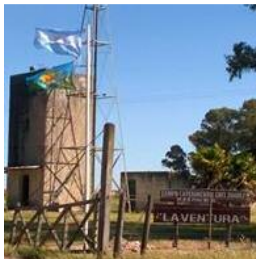
Ingreso a la Chacra

Entre 1981 y 1985 se realizaron en ensayos comparativos de rendimiento de gramíneas perennes que comprendían los géneros Phalaris , Lolium , Festuca y Dactylis , estableciéndose algunas diferencias de producción de forraje dentro de cada género. Se presentan como factores limitantes de adaptación la muerte estival de macollos de Raigrás perenne, y las enfermedades de hoja en algunos materiales de pasto ovillo, y un número importante de cultivares de diferentes especies expresó rendimientos altos de forraje en las condiciones del lugar.