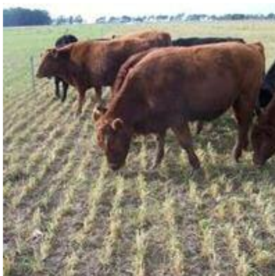
Ensayo en pasturas y alfalfa y ganadería