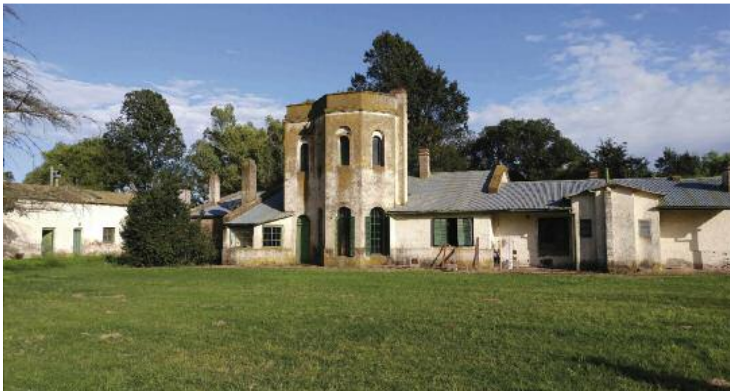
Administración Chacra Experimental Coronel Suarez

En 1960 se fundó en la colonia la primera escuela primaria y se conformó el Club Rural La Ventura para actividades deportivas y sociales, en 6 hectáreas y galpones cedidos por el Ministerios de Asuntos Agrarios, funcionando la escuela hasta fines de la década de 1980.