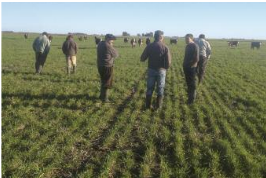
Jornada Cambio Rural

Unos meses más tarde, la Chacra recibió a un Grupo de Cambio Rural – Sierra de Curamalan en una jornada técnica referida a verdes y recría, con el objetivo realizar una presentación de la Chacra Experimental, su plan de trabajo y más específicamente los resultados sobre verdes y recría con distintos ensilajes de sorgo y cebada incluyendo un análisis económico y financiero.