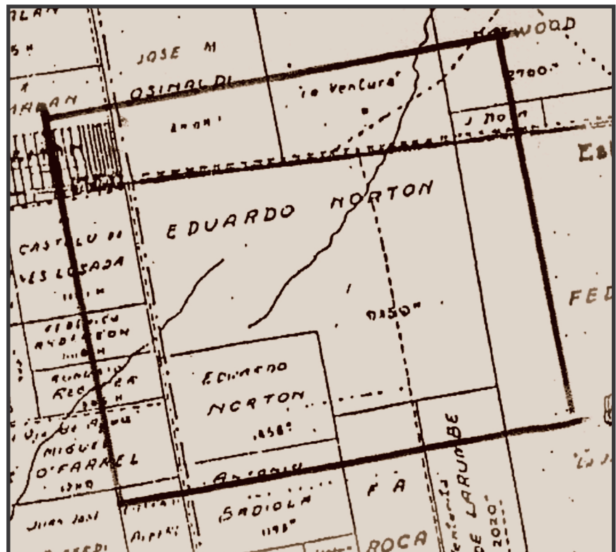
Plano de La Ventura de Norton

Por décadas los descendientes de los hermanos Norton cobraron en Londres la renta de sus tierras argentinas, pero los cambios políticos y la multiplicación de parientes en las nuevas generaciones los decidieron a vender la estancia en marzo de 1955.