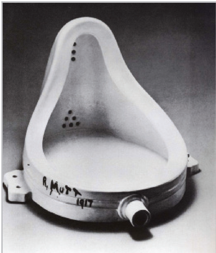
Fontaine (1917) - Marcel Duchamp

Las manifestaciones artísticas contemporáneas se valen de variados medios para expresarse. Cuestionan todos los estilos y estrategias de presentación, haciéndonos desconfiar hasta de la misma noción de arte. El público toma un rol protagónico: del placer estético, pasivo, se pasa a un placer reflexivo y activo.