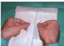
Colocar los guantes en el campo estéril.