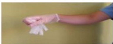
Recoger el primer guante con la otra mano