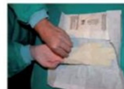
Coger el primer guante por la zona más cercana a nosotros e introducir la mano correspondiente, teniendo cuidado de no tocar la zona que entrará en contacto con el paciente (la superficie exterior del guante).