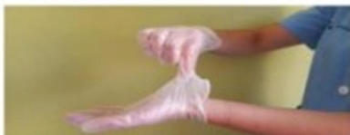
Pellizcar por el exterior del primer guante