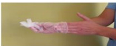
Retirar el segundo guante introduciendo los dedos por el interior