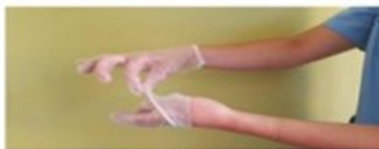
Retirar sin tocar la parte interior del guante