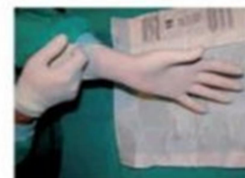
Para terminar la maniobra, introducir los dedos por la cara externa que quedó doblada y terminar de estirarlo. De este modo, no se producirá contaminación en ninguno de los guantes.