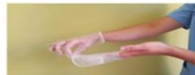
Retirar el guante en su totalidad