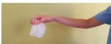
Retirar los dos guantes en el contenedor adecuado