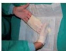
Para colocar el segundo guante, introducir los dedos tal como se indica en la fotografía. Así evitaremos la contaminación del primer guante.