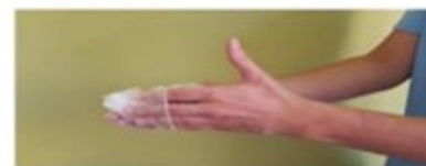
Retirar el guante sin tocar la parte externa del mismo